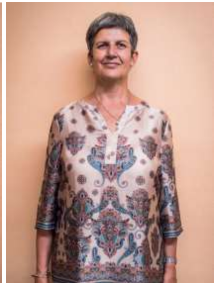
Médico y Medicina Integrativa